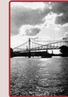
Der Kaisersteg um 1900

1898 wurde der Kaisersteg von der AEG errichtet, um ihren Arbeitern und Angestellten den Weg vom S-Bahnhof Schöneweide zu den AEG Fabrikhallen zu erleichtern. Im Volksmund wurde die Brücke auch „Schwindsuchtbrücke“ genannt, da sie nur drei Meter breit war und zu den Stoßzeiten bei Schichtwechsel leicht ins Schwanken geriet. Im April 1945 sprengte die SS diese und alle anderen Brücken in Schöneweide, um den Einmarsch der Roten Armee zu verzögern. Seit 2007 existiert die Brücke wieder als Fußgängerbrücke und verbindet Nieder- mit Oberschöne-weide.