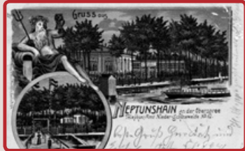
Gaststätte Neptunshain an der Oberspreee, um 1890

In dem Wirthaus „Neptunshain“ auf der Sedanstraße 50 (heute Bruno-Bürgel-Weg 131-139) befand sich seit Juli 1942 ein Zwangsarbeiterlager. Die Zwangsarbeiter mussten bei der Präzisionszieherei Albert Pierburg arbeiten. Spuren auf dem heutigen Gelände des Kanu-Sportclubs Berlin e.V. lassen erkennen, dass vermutlich auch zusätzlich noch Baracken als Wohnunterkünfte errichtet worden sind.