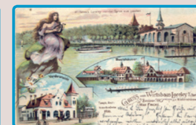
7 Wirtshaus Lorely mit Bootshäusern, um 1900