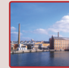
Blick auf die ehemaligen Industrieanlagen der AEG, 2008

Ende des 19. Jahrhunderts siedelten sich in Oberschöne-weide Fabriken der AEG an. Von großer Bedeutung waren dabei das älteste Drehstrom-Kraftwerk und das Kabelwerk Oberspreee, die vielen Menschen Arbeitsplätze sicherten. Die Fabrikhallen an der Wilhelminenhofstraße sind geschmückt mit Symbolen von Energieträgern.