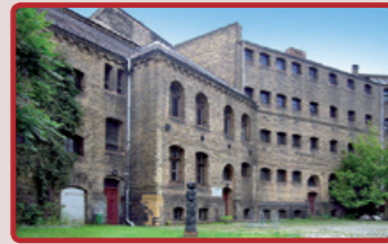
Ehemaliges Amtsgerichtsgefängnis, heute Gedenkstätte Köpenicker Blutwoche, 2007

Die Gedenkstätte „Köpenicker Blutwoche Juni 1933“ befindet sich heute im ehemaligen Gefängnis des Amtsgerichtes Köpenick. Während der Köpenicker Blutwoche beschlagnahmte die SA das Gefängnis, um es als zentrale Haft- und Folterstätte in Köpenick zu missbrauchen. Die SA führte in dieser Woche einen brutalen Kampf gegen Hunderte von Regimegegnern. Über 20 Menschen starben an den Folgen der Misshandlungen durch die SA. Die Gedenkstätte auf der Puchanstraße 12 ist immer donnerstags von 10-18 Uhr geöffnet.