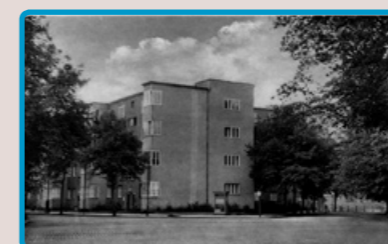
5 Spreesiedlung zur DDR-Zeit