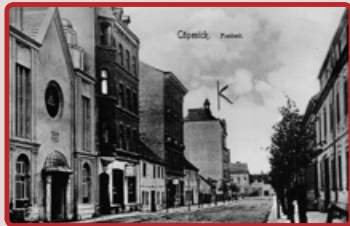
Die Synagoge in Köpenick, um 1910

Die 1910 errichtete Synagoge der jüdischen Gemeinde in Köpenick stand in der Freiheit 8. Heute erinnert nur ein Gedenkstein daran. Während der Pogromnacht im November 1938 plünderte die SA die Synagoge und steckte sie in Brand. Die Ruine wurde nach Kriegsende abgetragen.