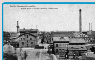
2 Die Fabrik der Gebrüder Lehmann, um 1890