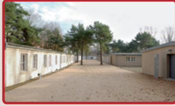
Das GBI-Zwangsarbeiterlager, heute Dokumentationszentrum NS-Zwangsarbeit, 2008

Auch in dem Industriestandort Schöneweide mussten während des Zweiten Weltkrieges zahlreiche Menschen aus allen Teilen West- und insbesondere Osteuropas Zwangsarbeit leisten. 1943 wurde an der Britzer/ Ecke Köllnische Straße ein Unterkunfts-lager aus Stein für über Zweitausend Zwangsarbeiter gebaut. Es ist das einzige in Berlin, das bis heute als Gesamtensemble erhalten geblieben ist.