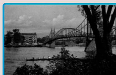
3 Kaisersteg, um 1910